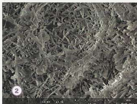
② CŒUR RENFORCÉ EN SULFATE DE CALCIUM DIHYDRATÉ Résine hydrofuge et fongicide