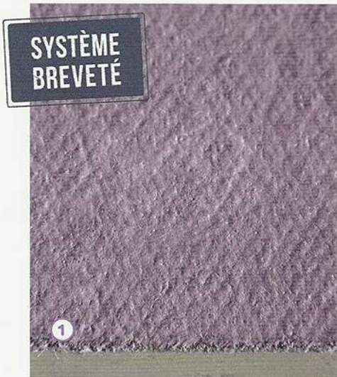
① VOILE HAUTE TECHNOLOGIE Fibres techniques imprégnées

WEATHER DEFENCE BD20 est composé d'un cœur en sulfate de calcium dihydraté de haute densité et fortement hydrofugé, compris entre deux parements de haute technologie. Cette exclusivité Siniat permet de répondre aux contraintes techniques extérieures les plus sévères.